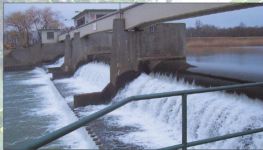
A Nicki duzzasztómű - az első magyarországi tömlősgát