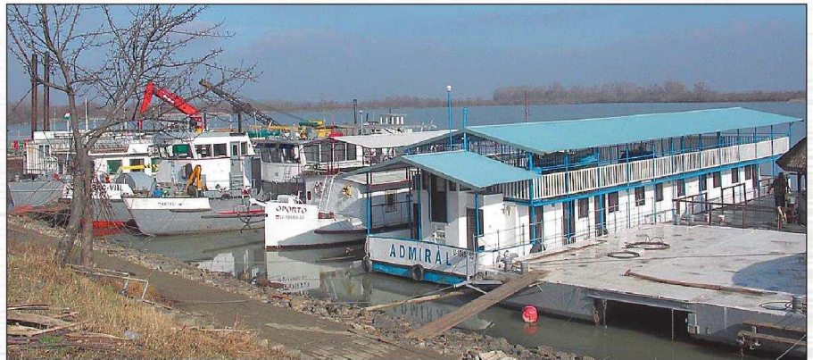
Téli pihenőhely, Kisköre

évben termelt energia mennyisége több mint a háromszorosa (70 390 000 kWh) volt az I. félévének, mellyel fennállásuk óta a legjobb félévi teljesítményt produkálták.