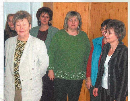
Az évzáró buli előtti pillanatok a mezőtúri szakaszon