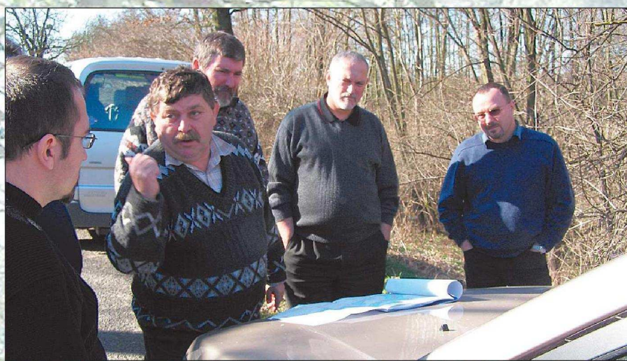
A kollégáinknak lehetőségük nyílt megtekinteni a Rába folyót