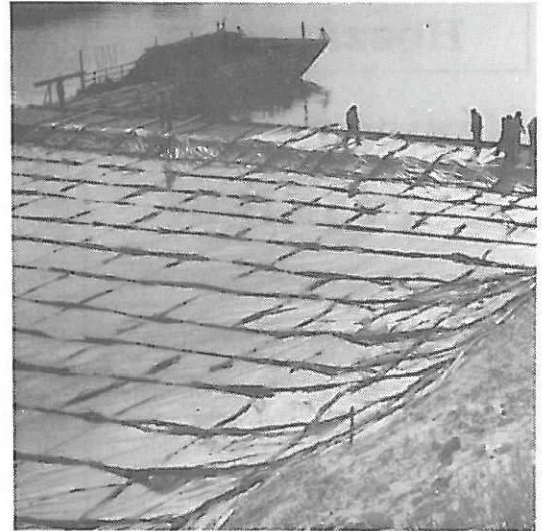
Úszórőzsepkróc a Tiszán

A kedvező vízállást kihasználva az elmúlt hónapban folytatódott a Tiszabög tiszakécskei kanyarban a meder-