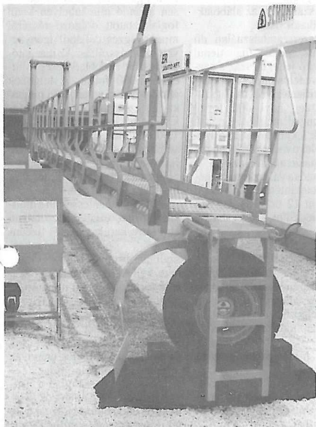
Szennyvíztelepi forgókotró a BVN-n

Igazgatóságunk ismét kiállított a Budapesti Nemzetközi Vásáron. Hagyományoknak megfelelően a III/2. építőipari zabadterületen a VIBESZ standon állítottuk ki legújabb gyártmánycsaládunk - a könnyűszerkezetes kotróhidak 28 méteres tagját, valamint az elmúlt évben is kiállított